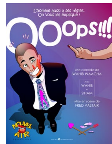
Précédemment Théâtre Laurette Paris 2018

Propos recueillis par Wahib Waacha en exclusivité pour DESPERATE MAMIES