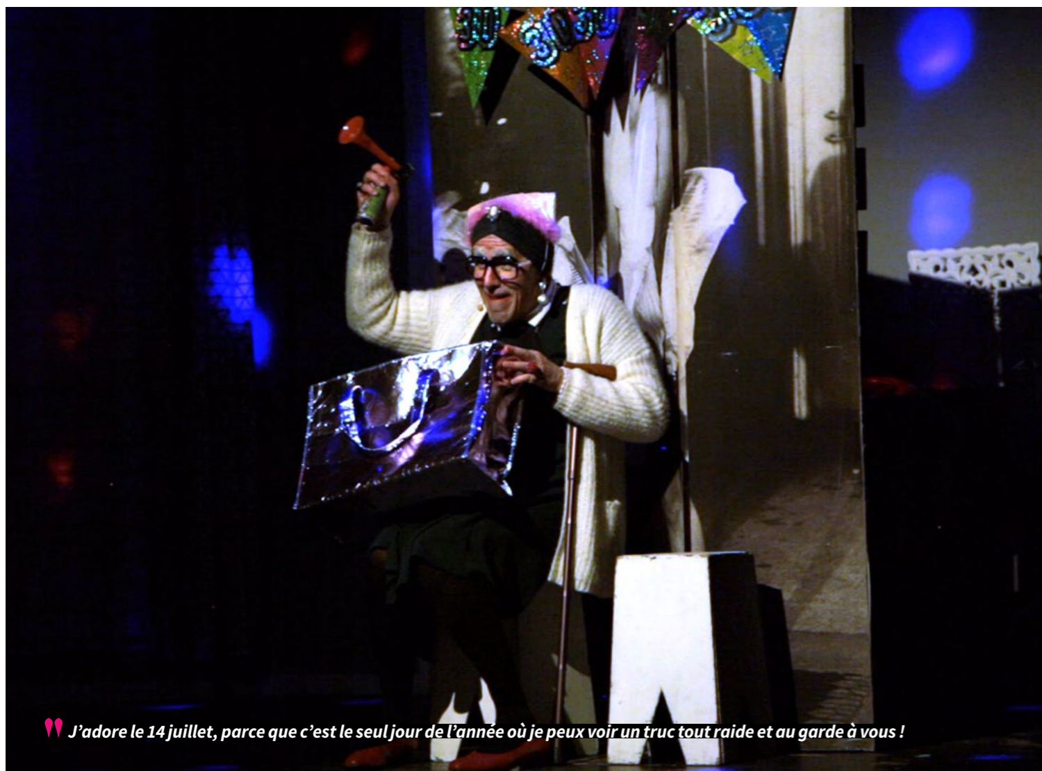
💗 J'adore le 14 juillet, parce que c'est le seul jour de l'année où je peux voir un truc tout raide et au garde à vous !